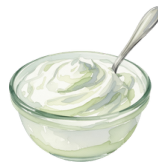
1 yaourt nature