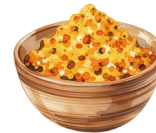
1 càs de Curcuma