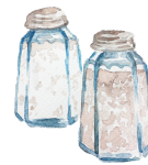
Poivre & Sel